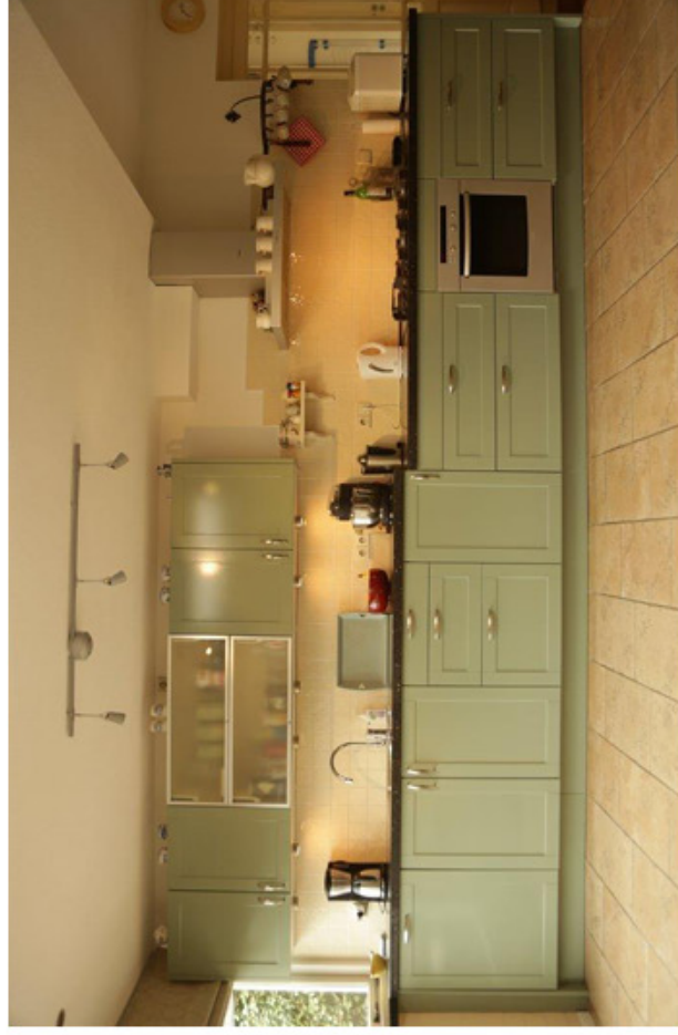
"De keukens van mevrouw Spaan uit Zoetermeer vóór en na de renovatie."